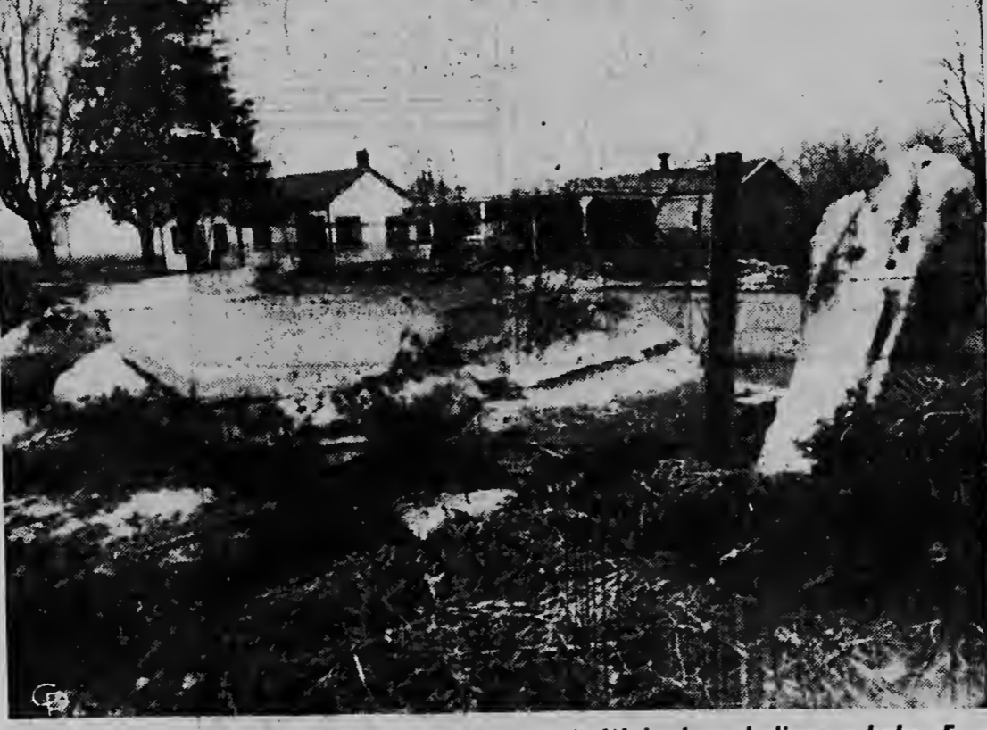
Esakinan ta bloki grandi di ijs cu a keda atras ora cu e rio Wabash na Indiana a baha. E escena aki ta na Delphi. E rio cu tabata ronca segun ela subi tabata e peor den 46 años.